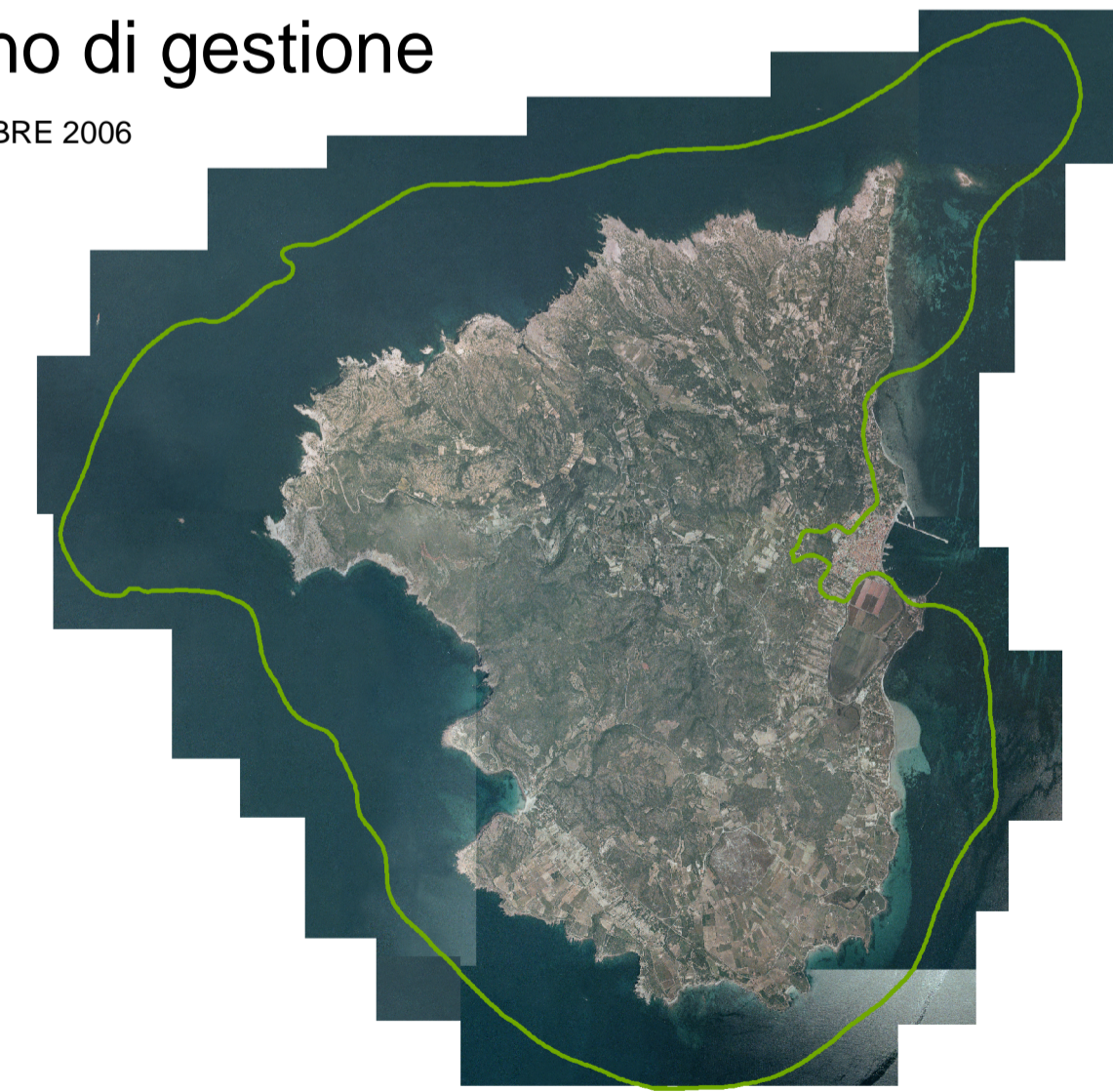
Tav. 5.2 - Copertura vegetazionale e flora d'interesse